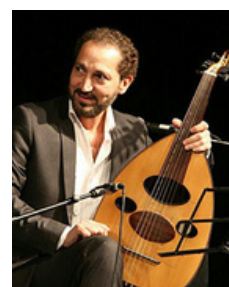
Naseer Shamma (Irak)