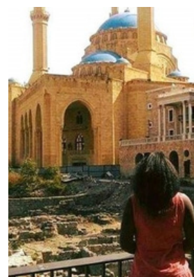
Mosquée Al Amine (Beirut)