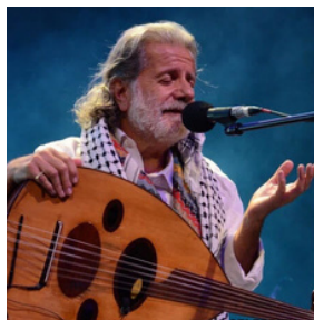
Marcel Khalife (Liban)