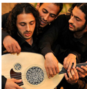
Trio Joubran (Palestine)