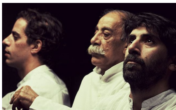
Trio Chemirani (Iran)