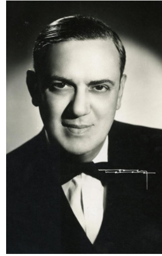
Ernesto Lecuona (1895-1963)

Hommage à Cuba dans un programme dédié à trois compositeurs majeurs du territoire. Manuel Saumell était considéré comme un des pères fondateurs du style cubain classique, et on le surnommait le "Petit Schubert de Cuba". Il a révolutionné la composition en mélangeant tradition classique occidentale et rythmes traditionnels créoles. Ses contradanzas pour piano, présentées ici, ont la forme de chansons populaires dansantes et festives.