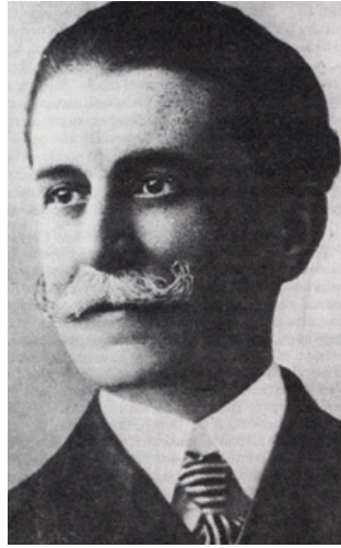
Ignacio Cervantes (1847-1905)