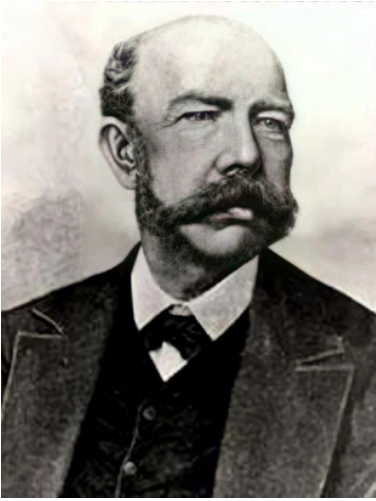
Manuel Saumell (1818-1970)