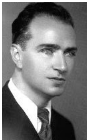
Joaquín Rodrigo (1901-1999)