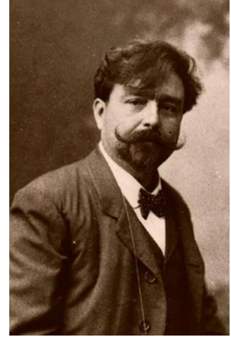
Isaac Albéniz (1860-1909)