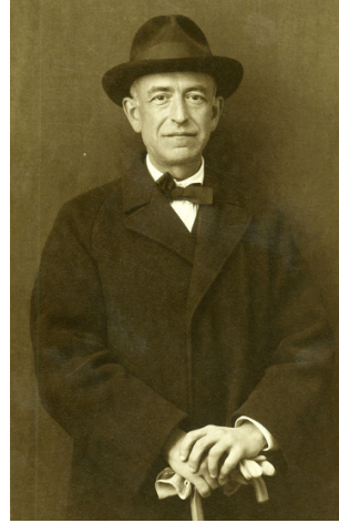
Manuel de Falla (1876-1946)