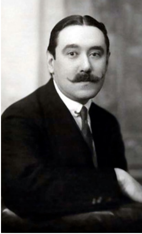
Joaquín Turina (1882-1949)