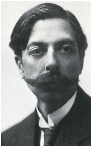
Enrique Granados (1867-1916)