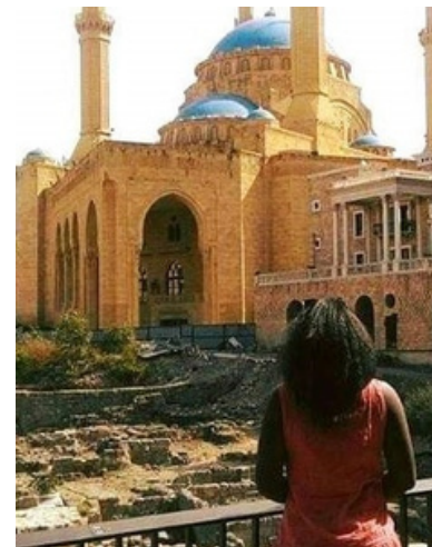
Mosquée Al Amine